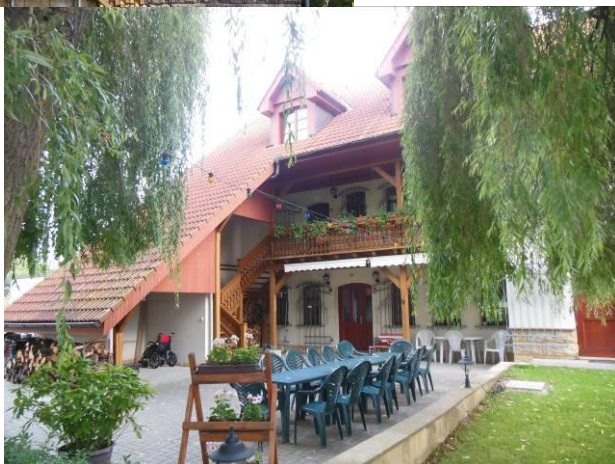
Penzion U Bukovského rybníka v Trní u Sobotky na Jičínsku