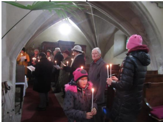
foto z dětské bohoslužby v Kaplici 4.2.