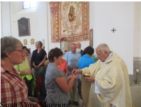
Santa Marie Maggiore

Svátek P. Marie Sněžné navazuje na událost, které se dle legendy odehrála v Římě ve 4.stol za papeže Liberiana. Ten měl sen o napadnutí sněhu na pahorku Esquilin, což rozhodlo o výstavbě baziliky, která se nyní nazývá