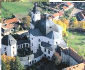
poutní kostel Křtiny