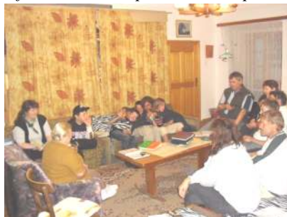
foto z farní dovolené