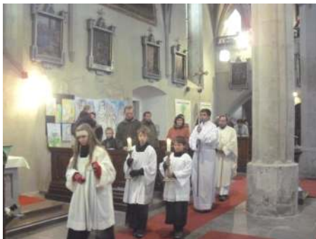
průvod k oltáři