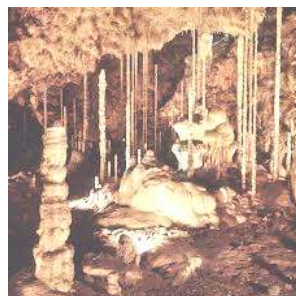
Moravský kras - jeskyně