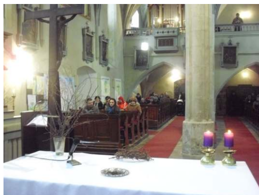
pohled do kostela v Kaplici na Popeleční středu