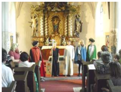
foto z dětského představení o pouti