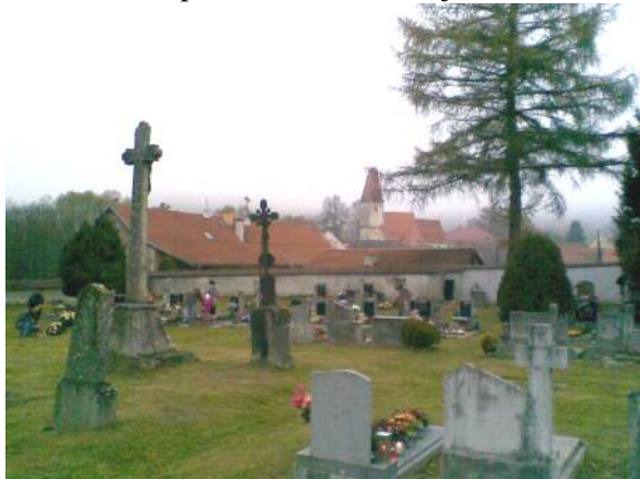
fotografie hřbitova v Rychnově nad Malší