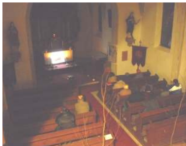
„Getsemanská zahrada“ v Kaplicive 21h