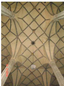
fotoklenby kostela Sv. Jiljí