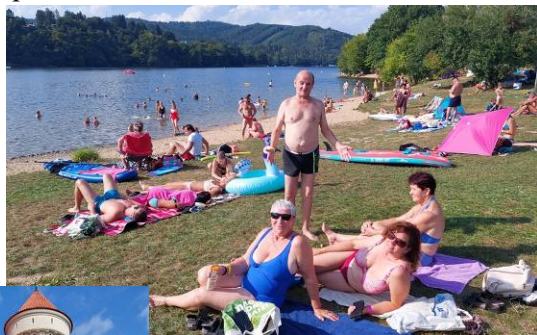
U Slapské přehrady