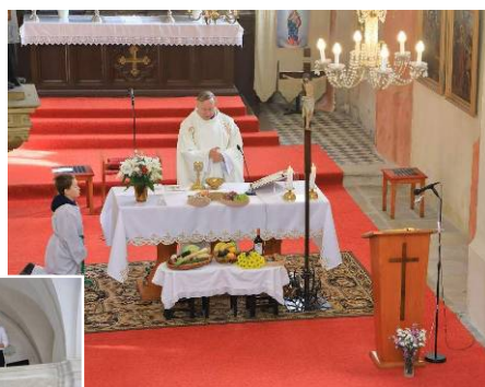
mše sv. s díkyvzdáním za úrodu