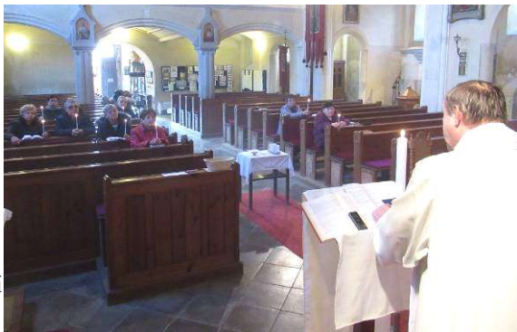
Oslava vzkříšení v kostele na Velikonoční pondělí