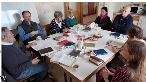
foto z ekumenické biblické hodiny v Arše