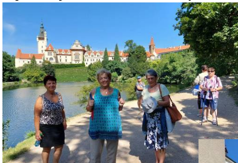
V průhonickém parku