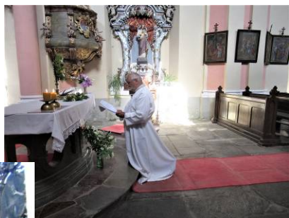
foto ze svátku Těla a Krve Páně