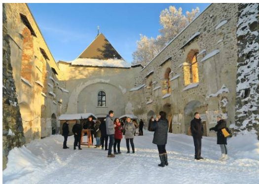
z vánoční bohoslužby