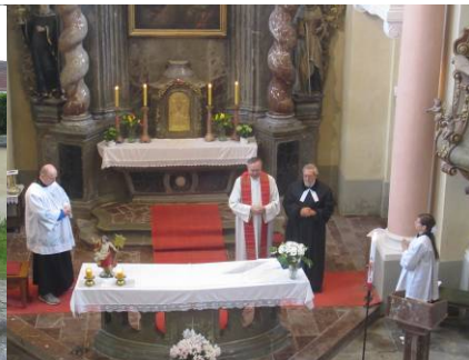
Účastníci poutní mše sv. – o svátku sv. Jana Nepomuckého