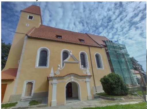
oprava jižní str. kostela a sakristie