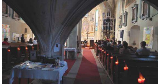
O noci kostelů byl opět koncert při svíčkách a před ním vystoupily děti z DDM Kaplice.