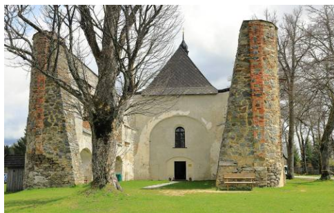
foto z poutní slavnosti 10.9.