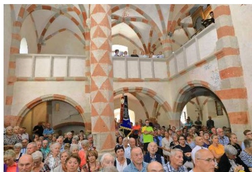
z poutní bohoslužby 12.8.