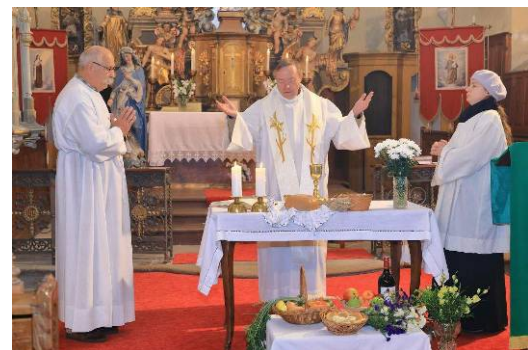
Děkuvzdání za úrodu