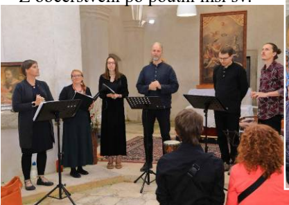
Z četných koncertů a také poutní bohoslužby v Klení, kde se v r. 2023 podařila obnova jižní fasády