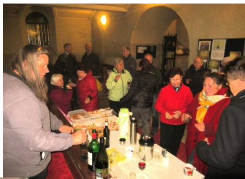
Občerstvení po poutní oslavě 28.10.