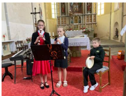
z dětského koncertu