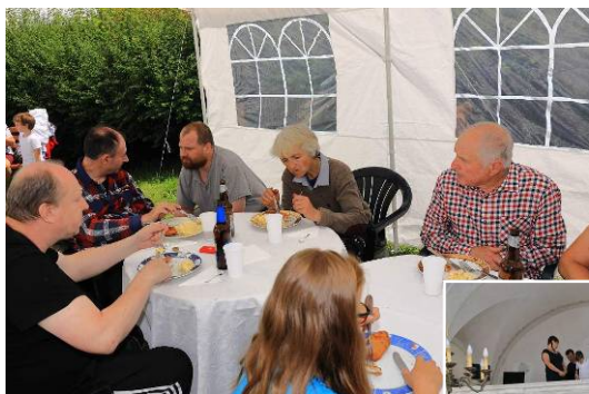
Z občerstvení po poutní mši sv.