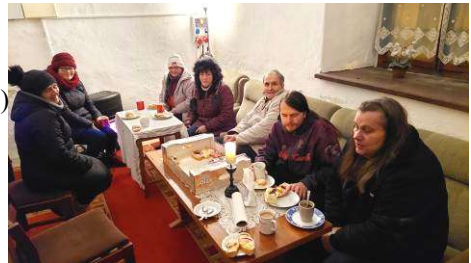
mše a občerstvení o svátku sv. Ondřeje