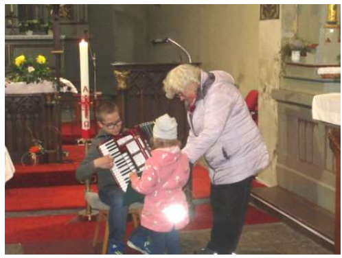
Do pásma hudby a poezie se zapojují i děti