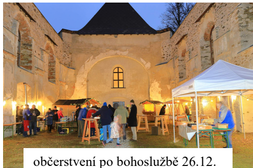
občerstvení po bohoslužbě 26.12.