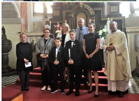
společná fotka → z 1. sv. přijímání