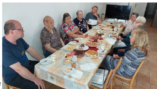
setkání ve společenství ve čtvrtek