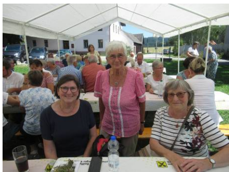
V úterý 15.8. se konala česko-německá bohoslužba. Tradičně i s obědem u kostela.