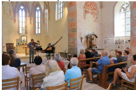
V neděli 10.9. zde koncertoval soubor Cantus Firmus a Rožnovské hudební sdružení.