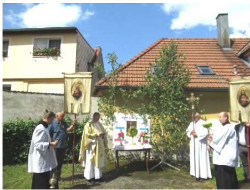
I letos jsme slavili svátek Božího Těla venku.