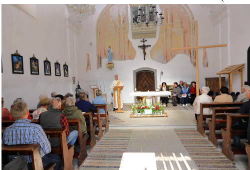
Mariánská pobožnost v květnu