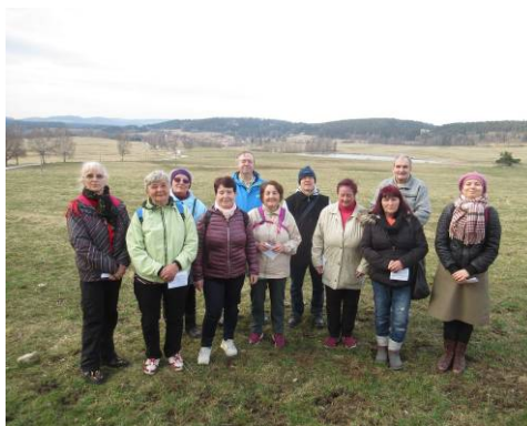
V březnu se konalo putování kolem 7 kapliček bolesti Panny Marie