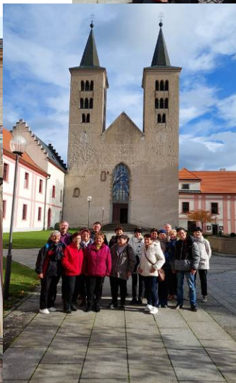
V sobotu 28.10. jsme se vydali na zájezd na Svatou Horu a do kláštera v Milevsku.