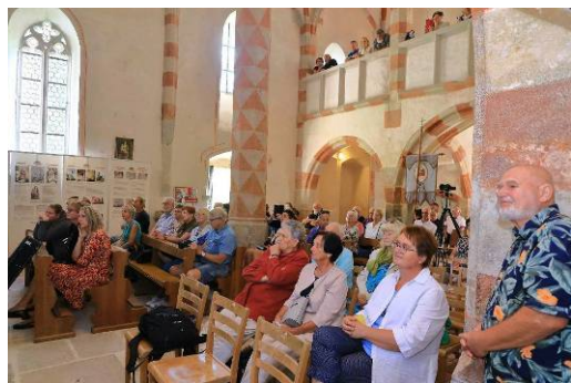
Navečer zde byla česká mše sv. a během odpoledne i občerstvení u kostela.