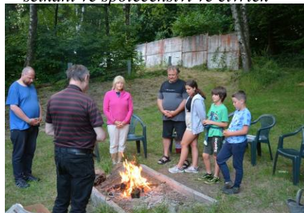
z táboračky ↗