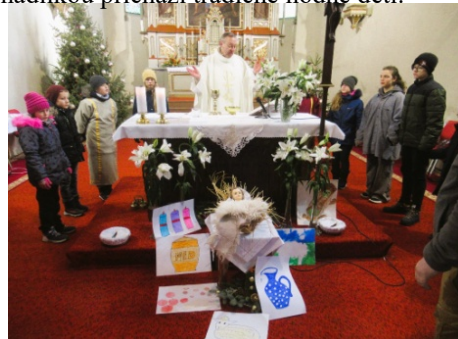
I na vánoční mši sv. se scénkou přijde dost dětí.