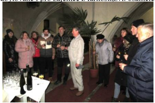
O Silvestru se koná přípitek v kostele i na faře