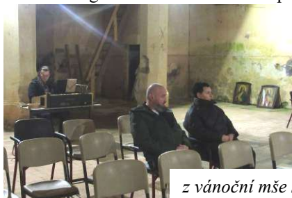
z vánoční mše sv. v Pohorské Vsi