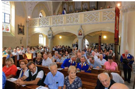
Bohoslužba s biskupem při setkání rodáků v neděli 20.8. Dechová kapela z Rainbachu (A)