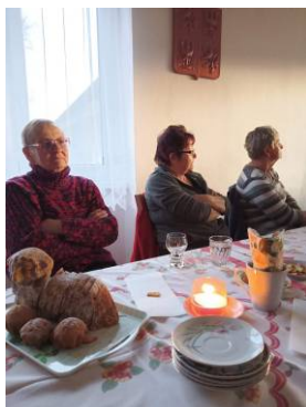
Velikonoční večere v klubovně na Obci