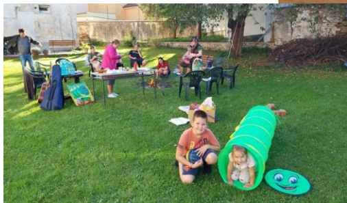
Na faře konáme táboráky a např. při Malé pouti u kostela sv. Floriána občerstvení po mši sv.