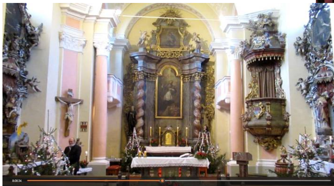
Vánoční výzdoba v kostele