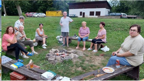
V přírodě jsme slavili bohoslužby i konali opékání u táboráku.