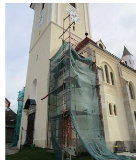
Oprava západní strany chrámu