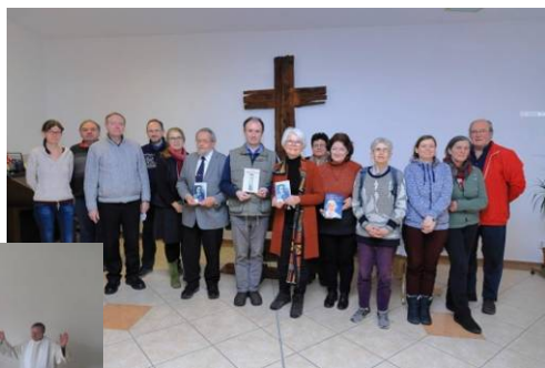
lečných biblických hodinách a také na různých přednáškách v Arše