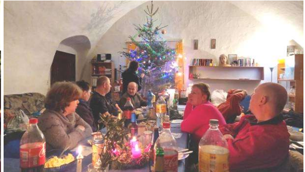
O Štědrém večeru se koná na faře večere pro ubytované i pro zájemce z farnosti, zvl. osamělé.