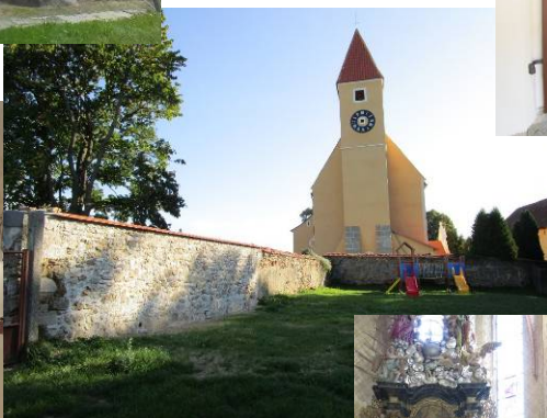
opravená část hřbitovní zdi