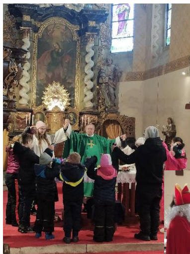
z adventní dětské bohoslužby a mikulášské nadílky