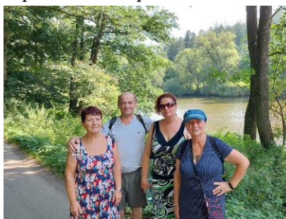
U řeky Sázavy. Na Konopišti.