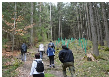
výšlap o pouti na rozhlednu