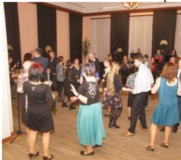
I v r.2023 jsme konali Křesťanský ples, kterého se účastnili i přátelé