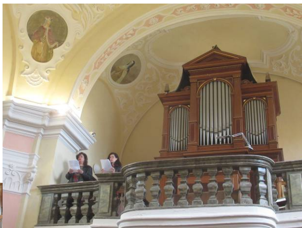
zpěv z kůru