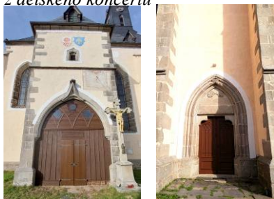
opravené dveře bočního a hl.vchodu