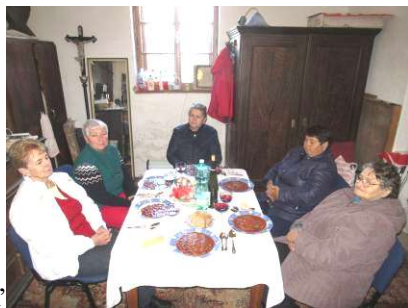
velikonoční večeře v sakristii kostela