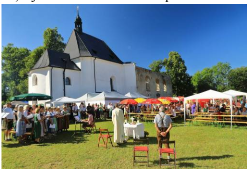
Poutní mše sv. 10.9.