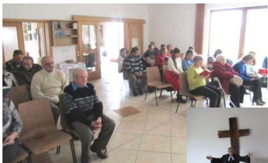
Scházíme se na ekumenických bohoslužbách a 2x za měsíc i na spo-