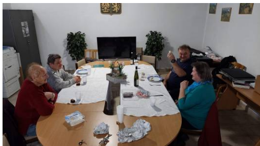
O Svatém týdnu se také scházíme ke společné velikonoční večeři s nekvašenými chleby a potom prožíváme modlitbu s Kristem v Getsemanech.