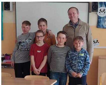
Přípravu na 1.,sv.přijímání vedl i P. Pavel