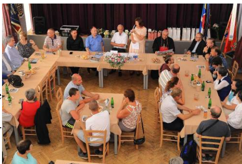
setkání rodáků na Obci s biskupem při obědě