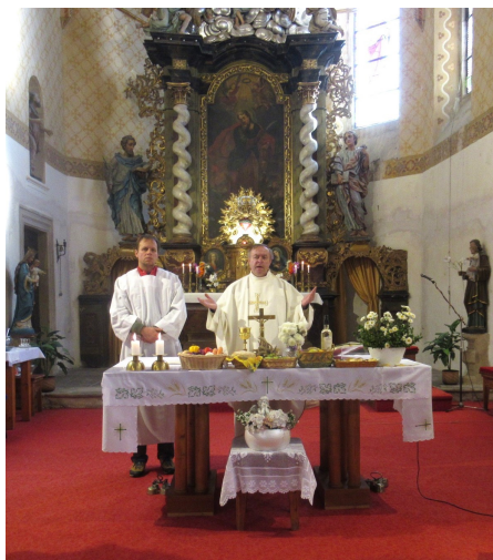
z důkůvdání za úrodu