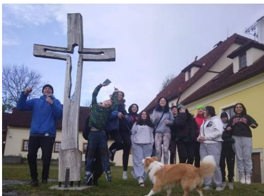
I mladí z Pohorské vsi byli na Ktiši