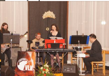
různých křesťanských církví. Vystoupila zde i křesťanská kapela