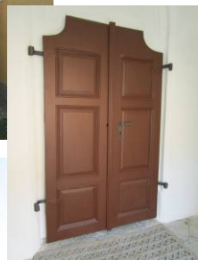
opravené hl. dveře kostela