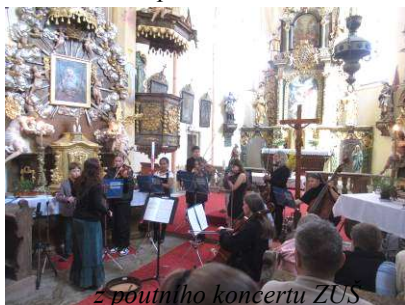
z poutního koncertu ZUŠ z koncertu ZUŠ