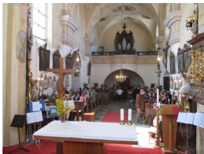
z koncertu před svátkem sv. Jiří