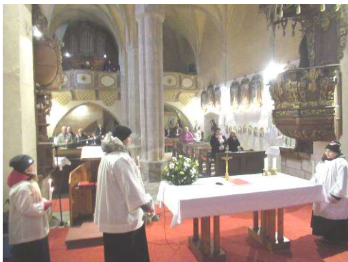
z velikonoční mše sv.