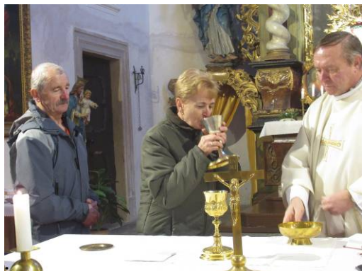
z bohoslužby Zeleného čtvrtku