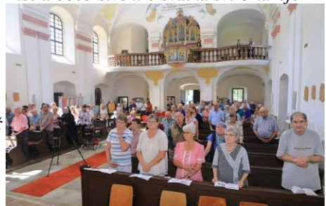
z poutní mše sv. 6.8. na Sv. Kameni