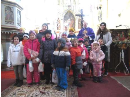
Na dětskou mši sv. spojenou s mikulášskou nadílkou přichází tradičně hodně dětí.