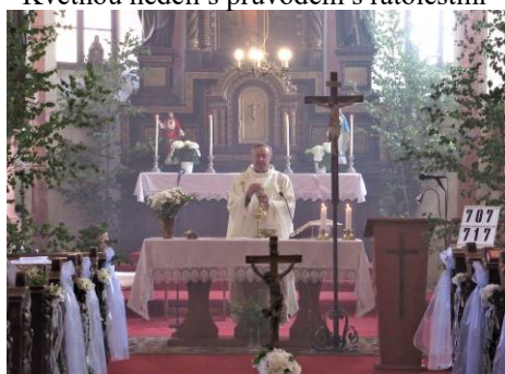
Mše svatá o svátku Božího Těla