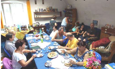
U stolu na faře se setkáváme nejen při velikonoční večeři, ale i při oslavách narozenin a svátků