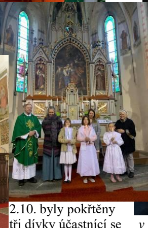
2.10. byly pokřtěny tři dívky účastníci se hodin náboženství