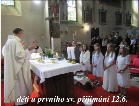
děti u prvního sv. přijímání 12.6.