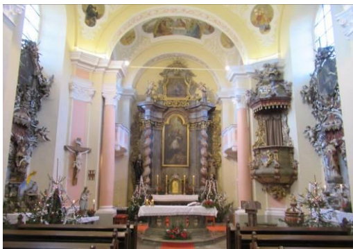
Vánoční výzdoba kostela