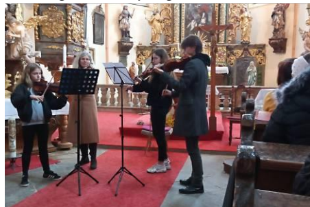
z poutního koncertu ZUŠ