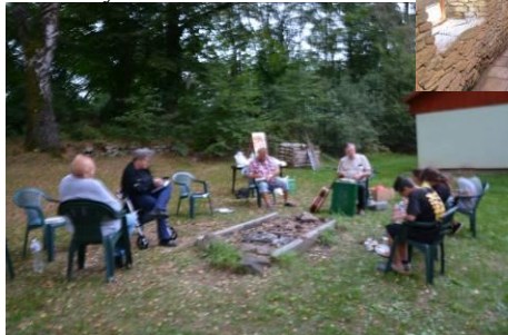
O prázdninách jsme konali farní táborák s hrami pro děti. Foto z 30.8. v areálu bývalého Svazarmu