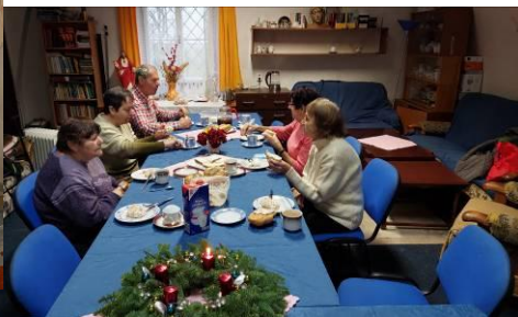
v adventu po ranní mši sv. ve čtvrtek v 7h následuje snídaně