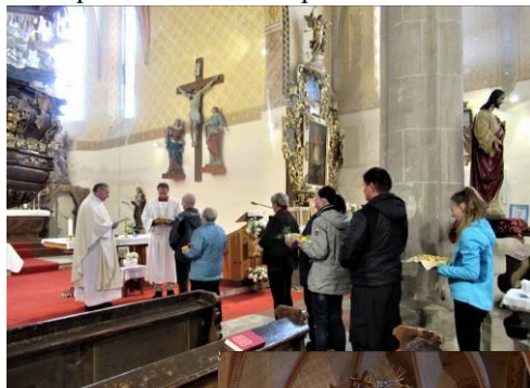
Horní dvě fotografie a jedna vlevo níže zachycují slavnost Výročí posvěcení chrámu a díkůvzdání za úrodu. Je třeba stále za vše děkovat