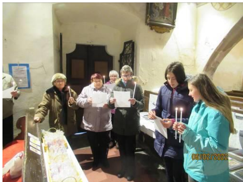
z oslavy svátku Uvedení Páně do chrámu