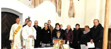
Mše sv. o Velikonoč.pondělí