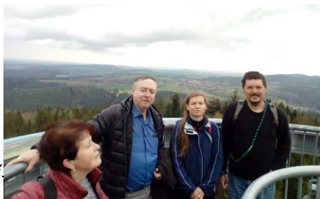
z poutního výšlapu na rozhlednu