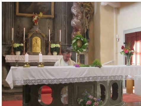
Adorace o svátku Božího Těla