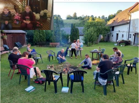
na faře se v létě setkáváme i u táboráků