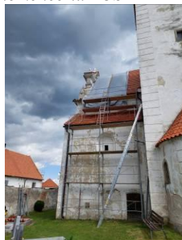
opravy střechy kostela