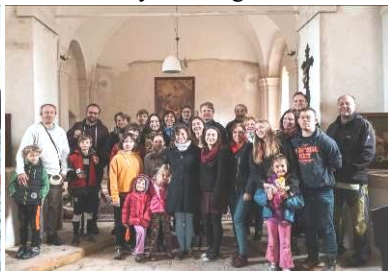
akce mladých budějovičáků v Klení