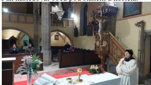
Z poutní slavnosti patrona kostela sv. Ondřeje v Rychnově a následně posezení a občerstvení