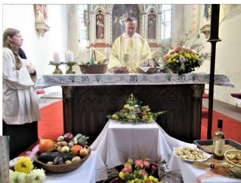
Děkuvzdání za úrodu 30.10.