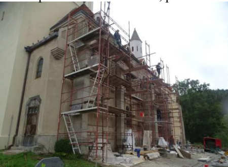
Oprava jižní stěny chrámu