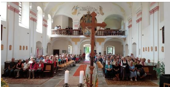
z poutní mše sv. 7.8.