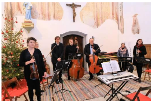
Novoroční koncert 2.1.2022 a občerstvení ve venkovních prostorách kostela.