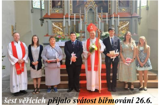
šest věřících přijalo svátost biřmování 26.6.