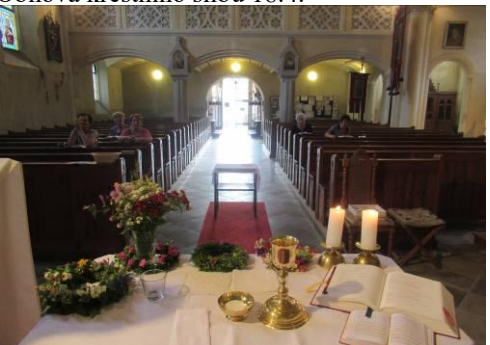
Oslava patronů kostela 28.10., posvěcení a děkování+ následné posezení u stolu s občerstvením