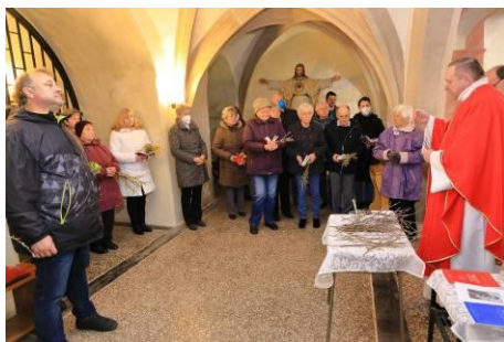
z obrádků Květné neděle