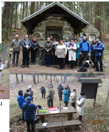
foto z křížové cesty a občerstvení

- opravit vnější fresku – iluzivní okno na kostele