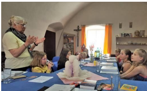
Příprava na 1. sv. přijímání probíhá na faře