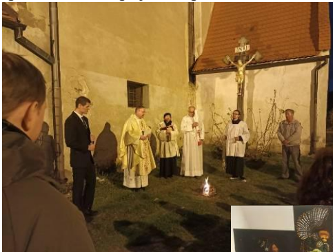
Velikonoční vigilie začíná v noci Děti u Kristova hrobu