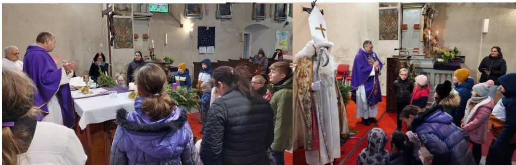
Dětská mše sv. je 1. neděli v měsíci, mimo srpen. Bohužel v poslední době je dětí stále méně