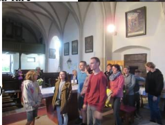
z noci kostelů 10.6.