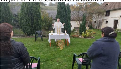
v létě bývají mše sv. také na farní zahradě