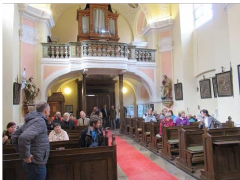
Z přednášky o historii kostela 11.9.