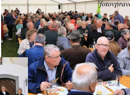
občerstvení o pouti 11.9.