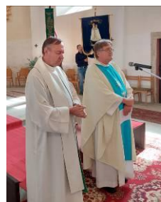
Kněží na pouti 7.8.