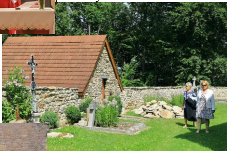
ce márnice a hřbitovní zdi