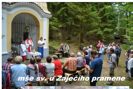
mše sv. u Zaječího pramene

Budeme se snažit – o to co se zatím nepodařilo, pokračovat v opravě kostela v Klení- fasády, a pořádat akce pro děti