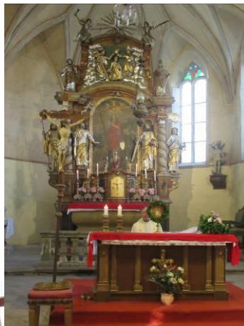
vpravo foto ze svátku Božího těla - adorace