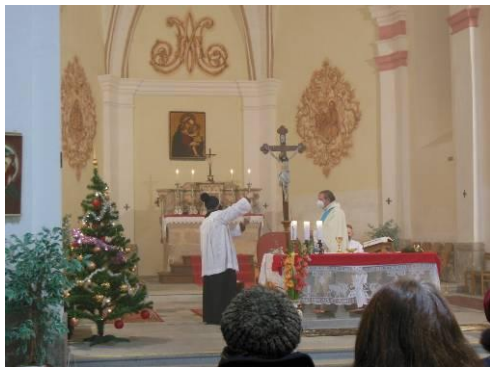
z Novoroční bohoslužby na Sv. Kameni