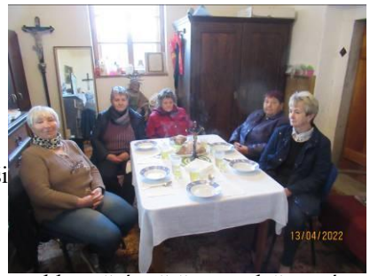
velikonoční večeře a společenství