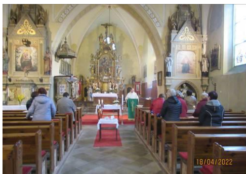
Oslava vzkříšení na Velikonoční pondělí 18.4.