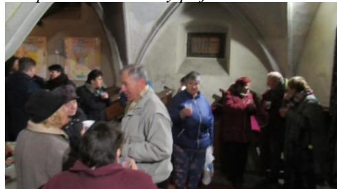
Hodně lidí navštěvuje předávání Betlém. světla