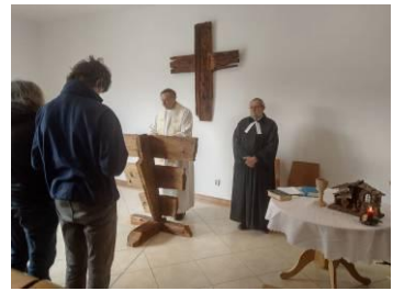
foto z ekumenické bohoslužby v Arše