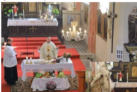
O Výročí posvěcení chrámu (letos 30.10.) se koná také díkyvdání za úradu. V říjnu jsme též slavili Den země.