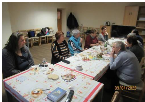
Velikonoční večere s nekvašenými chleby 9.4.