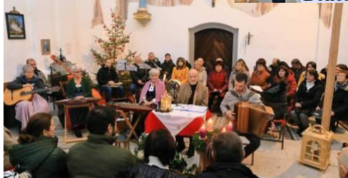
Adventní koncert 18.12.