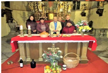
ze slavnosti Posvěcení a díkůvzdání