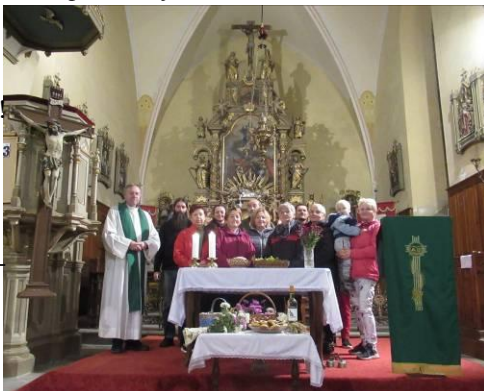
účastníci poutní slavnosti a díkůvzdání