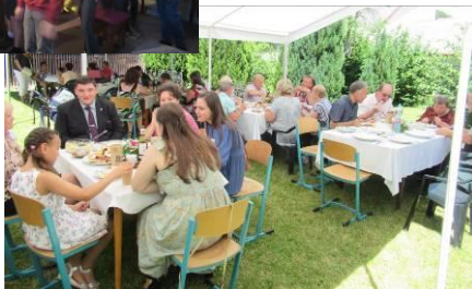
z Petropavlovské poutě-posezení na faře