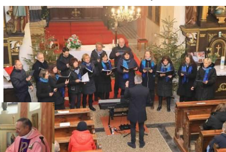
28.12. se v kostele konal vánoční koncert Kaplického pěveckého sboru