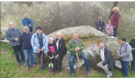
Nahoře: z procházky k vodnímu kameni 1.5.