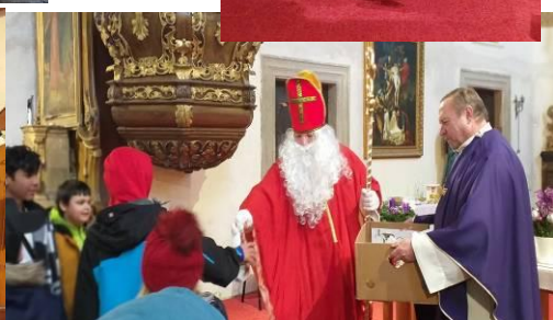
Při dětské mši sv. 4.12. se sešlo 20 dětí a po bohoslužbě dostaly nadílku od Mikuláše.