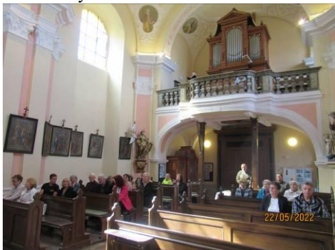
Poutní oslava 22.5.