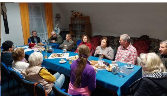
Foto ze setkání farní rady, ta se schází 2x ročně