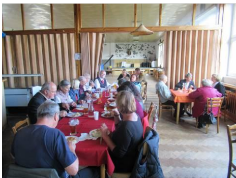
Po slavnostní mši na oslavu 300. výročí posvěcení kostela 11.9. následoval společný oběd s posezením u kávy a s hudbou