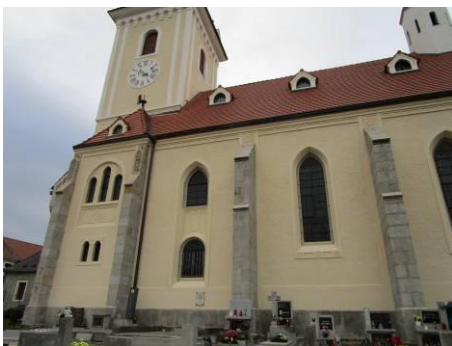
opravená jižní strana kostela