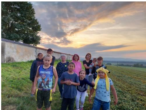
foto po letním táboráku pod kostelem 29.8.