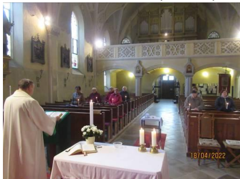
Obnova křestního slibu 18.4.