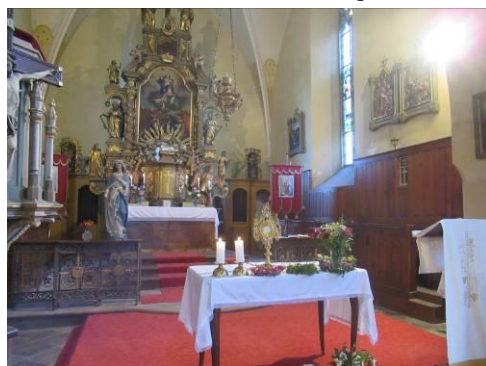
Slavnost Božího Těla 18.6. - adorace