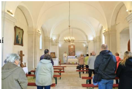
mše sv. v Klení v době velikonoční