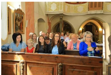
Poutní slavnost patrona kostela – sv. Jakuba se konala v NE 31.7. Obohacena